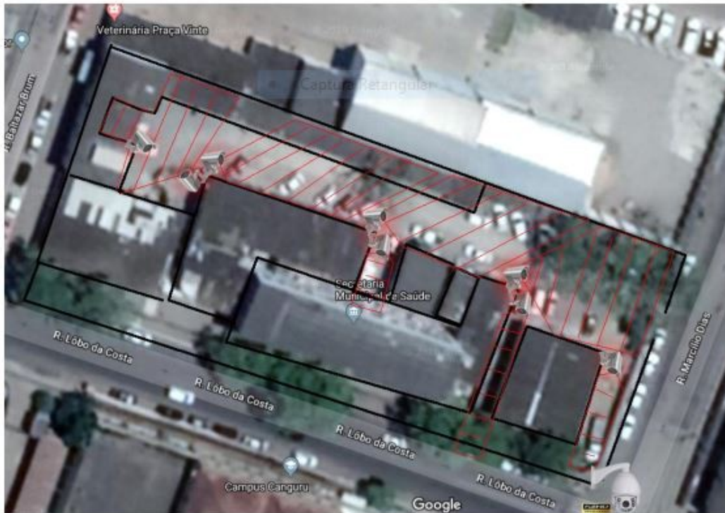
Imagem de satélite para visualização de pontos e intenção de cobertura.

ter capacidade de uma eventual ampliação, que comporte câmeras digitais e que tenha capacidade de armazenamento de no mínimo 30 dias de gravação e que seja ligado na internet e compartilhado com a Secretaria Municipal de Segurança Pública.