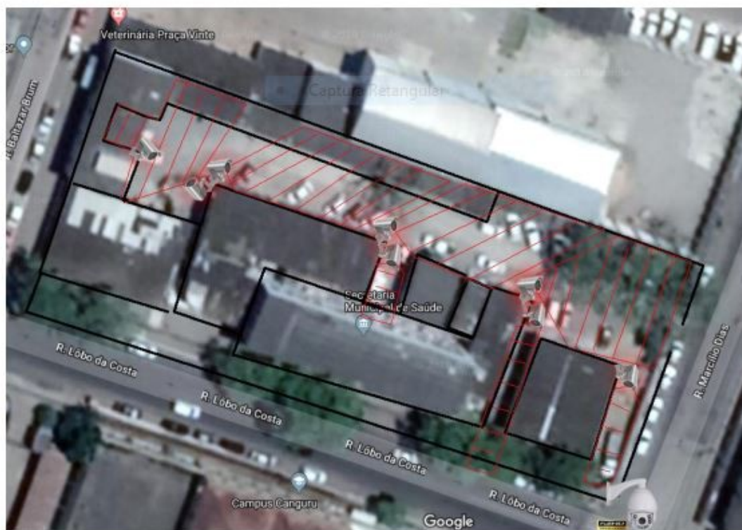
Imagem de satélite para visualização de pontos e intenção de cobertura, do prédio da Rua Lobo da Costa, 1764 – Centro – Pelotas/RS – CEP 96010-150

Para que seja possível a cobertura integral da recepção e no entorno da Secretaria de Saúde localizada na Rua Tiradentes, 3120 (Esq. Rua Barão de Santa Tecla) , são necessárias 2 (duas) câmeras digitais full HD com as seguintes especificações: