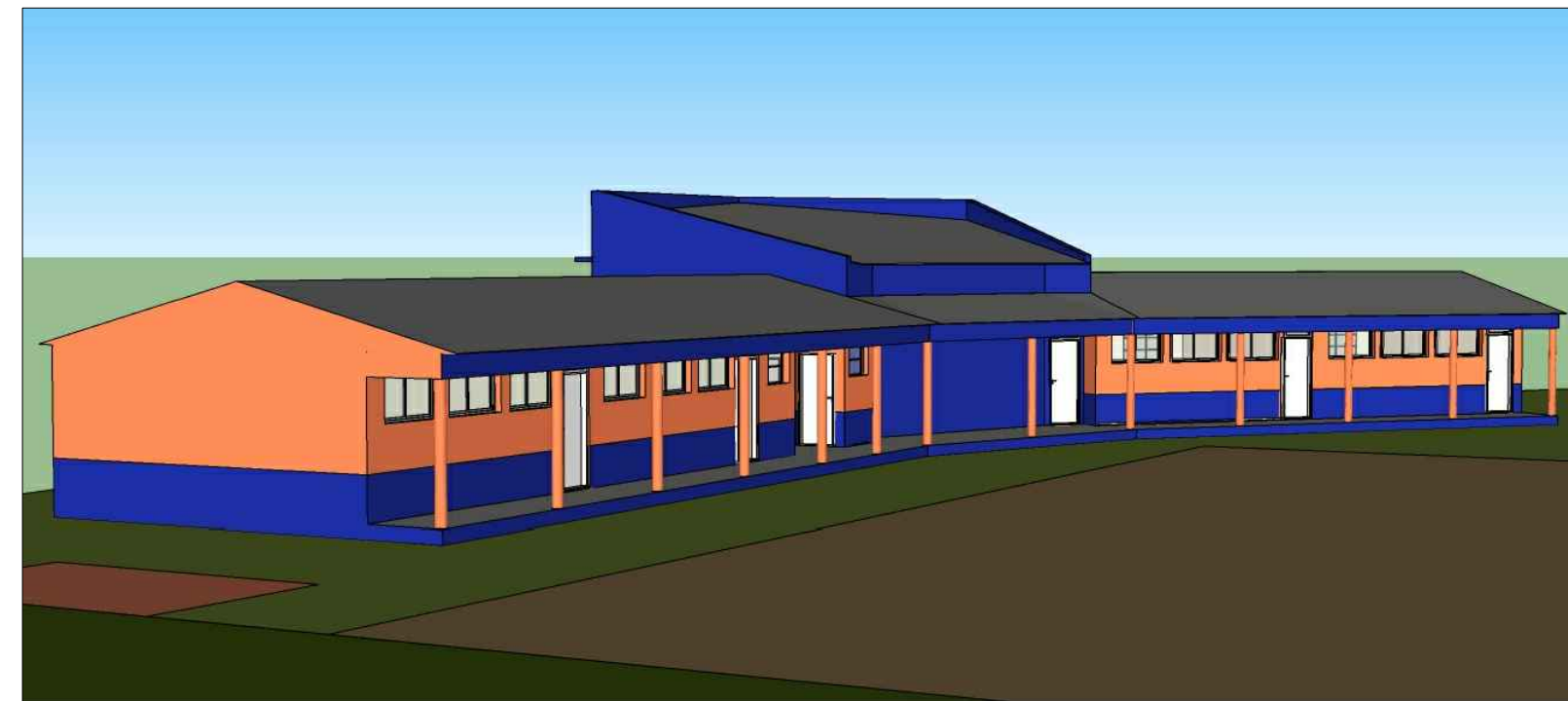
01 VOLUMETRIA E FACHADAS SEM ESCALA