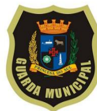
BRASÃO GM 2