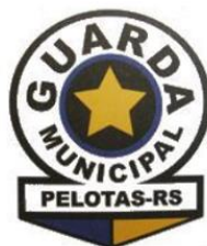
BRASÃO GM 1