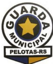
BRASÃO GM 1