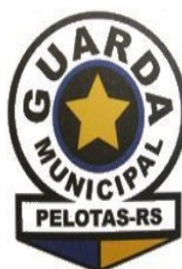
BRASÃO GM 1