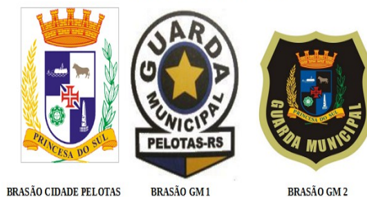
3.1 - LOGOS UTILIZADOS NA GOLA POLO GM