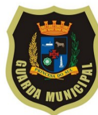
BRASÃO GM 2