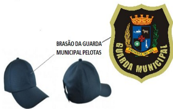
Imagens meramente ilustrativas. O produto deve ser similar com as características descritas neste documento.

Etiqueta interna costurada, na cor branca informando: Composição do tecido; modo/símbolos de lavagem, modelo/tamanho do manequim, Razão social e CNPJ do Fornecedor da confecção e do fabricante do tecido; Data e País de fabricação. Todos os Bordados HD/Termocolado devem ser confeccionados em etiqueta Tear Jacquard em alta definição, fundo em Super Prestige, figura em Poliéster fio Detrex com recorte a Laser e acabamento termocolante, fixados com prensa térmica e acabamento nas bordas de bordado em linha amarelo ouro, com pontos fechados (não podendo ser em ziguezague) na largura de 3mm. Tamanho: P, M, G e GG.